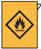
Produits chimiques ménagers (solvants, peintures, pesticides)